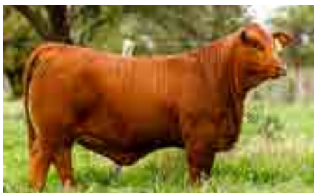
Hija de Nando en El Porvenir de Oroda