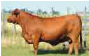
667, Abuela materna