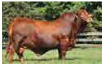
Tabasco, su padre