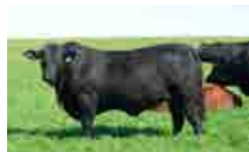
Temporal, su padre