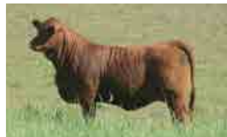
Hija de Nando, precio máximo remate El Coraje 2021