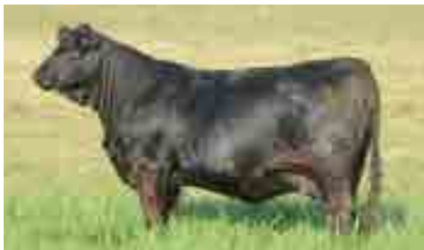
RP 1226 (Nando x Yas)