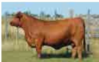
RP 667, su madre