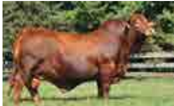
Tabasco, su padre

Zoom nos impresionó por su fenotipo, blandura de engorde, corrección de prepucio y crecimiento. Creemos estar frente al padre ideal y tan necesario para utilizar sobre las Pancho, Nando y Torque y continuar con la misma dirección de funcionalidad en ambientes pastoriles sin descuidar fenotipo y aportando muy buen temperamento. Su madre fue una de las 7 mejores vacas en la nacional 2019 de Argentina y es sumamente prolífica y blanda de engorde