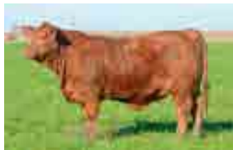
RP 1119, su madre