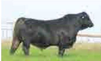
Criador, hno materno

Siempre es un desafío encontrar padres Brangus para utilizar en servicios de 15 meses, por lo tanto en El Coraje hemos trabajado arduamente en encontrarlos a través de más de 15 años de servicios precoces ininterrumpidos, priorizando siempre la extrema facilidad de parto pero sin dejar de lado la posterior performance de estos productos. Tranquilizante es hermano materno de Criador, toro ya probado con éxito en 15 meses del cual surgen extraordinarias hembras en cuanto a fertilidad, precocidad sexual y alto % de marbling en sus carcazas. Su madre la 284, es una de las vacas más fértiles y longevas de El Coraje y su medición de carcaza arrojó 7,7 % de grasa intramuscular. Tranquilizante se muestra con un temperamento excelente, gran calidad seminal y capacidad de servicio, excelente prepucio, pelo corto, muy blando de engorde y de tamaño moderado a chico. Ideal para los que quieren animales muy mantenidos, mansos y siempre con facilidad de parto.