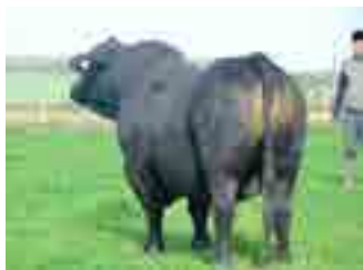
Mazacote, su padre

El mejor hijo del ya fallecido Mazacote. Su nombre proviene de la similitud de él con su padre, y de la similitud en corpulencia que tienen todos sus antepasados (mazacote, 667, 266, 79, Crossover, etc). También debido al alto grado de endogamia que él posee ya que sus abuelas 264 y 264 son hermanas enteras. Consistente es a la vez hermano materno del consagrado Nando, de Drago, Mostaza, Forlan, Levis y de muchas donantes de primera línea en El Coraje. Pensamos que su producción será muy predecible, de tremendo físico y alta performance.