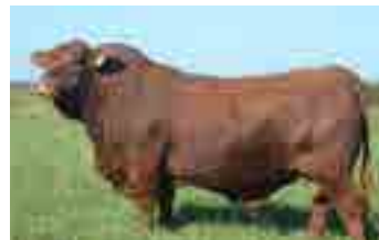
Nando, hermano entero de su madre