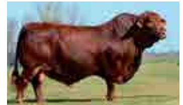
Cachamay, bisabuelo materno