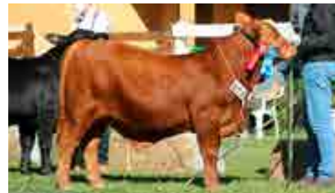
Hijo de Nando, Gran Campeón Nacional Invierno Paraguay 2021