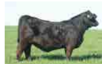
1215, hermana materna