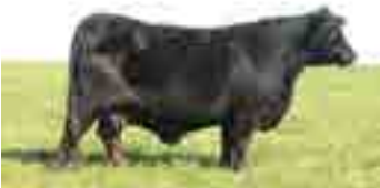
RP 79, Abuela materna