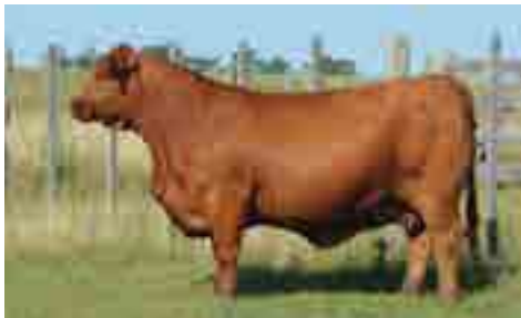
RP 667, su madre