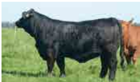
Hija de Nando x Relevante