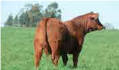
Hija de Nando en madre Ciriaco