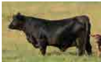
RP 1070, madre de Tropical

Calidad racial, masculinidad, clase, corrección son solo algunos de los adjetivos que surgen al conocer a Tropical. Este joven padre nos encanta no solo debido a su evidente superioridad en cuanto a lo fenotípico, sino también por la nobleza de su familia. En ella nos encontramos con una de nuestras donantes favoritas, la 1070 su madre. Su abuela la 667 es madre además de Nando, mostaza, Drago, Levis, etc y es una de las vacas más impresionantes que conocamos en la raza y su tatarabuela la 79 con 13 años continua en producción en El Coraje. Tropical congelo su primer salto de calidad a los 12 meses de edad evidenciando su alta precocidad sexual y libido.