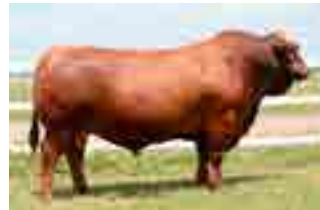
Red bull, abuelo materno