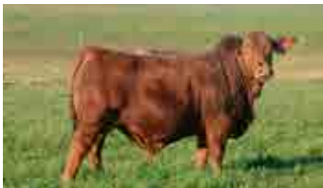
El Carnicero (Nando x 1119 Independencia)