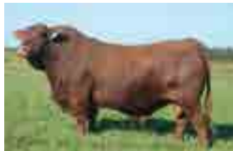
Nando, hno materno