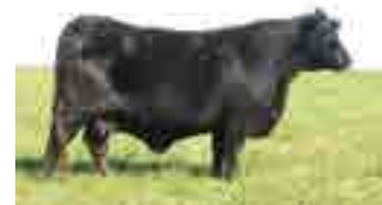
RP 79, su tatarabuela