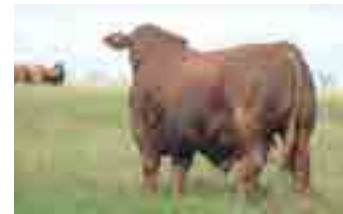
Drago, hno materno